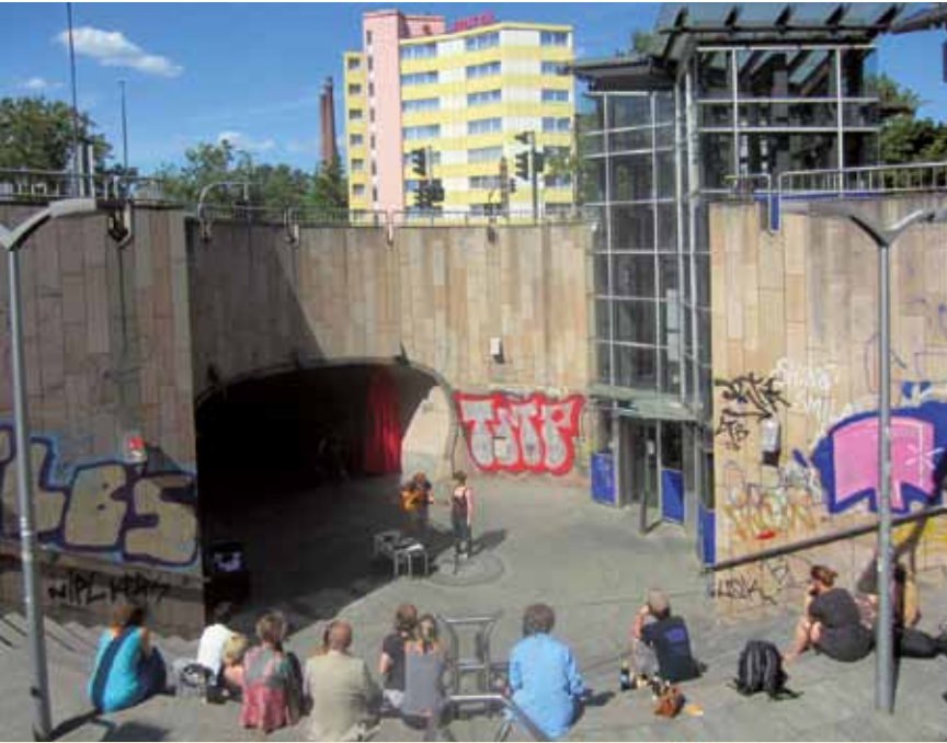
Kunstprojekt „Urbane Montagen“: Amphitheater. OPEN STAGE Art Project „Urban Montages“: Amphitheatre. OPEN STAGE

sondern es kommt zu einer zweifachen kulturellen Ausgrenzung: erstens in der Abstufung von Event-Hochkultur bis freier Kunstszene und zweitens in ethnischer Hinsicht. Das führt zu geschlossenen lokal-ethnischen Milieus im urbanen Raum und verhindert den interkulturellen Austausch, der eigentlich das Ziel von Kulturhauptstädten ist.